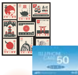
切手・テレホンカード